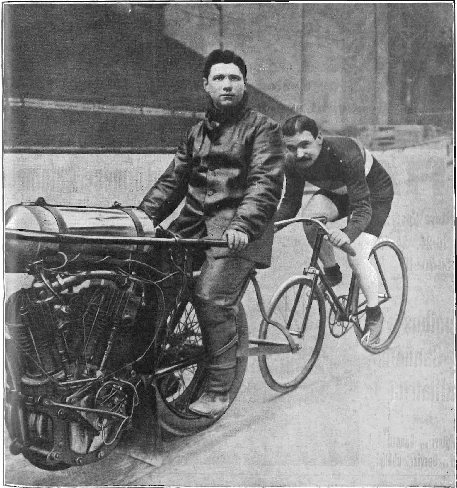
GUIGNARD, recordman mondiale dell'ora.

(Dalla Galleria della "Stampa Sportiva")