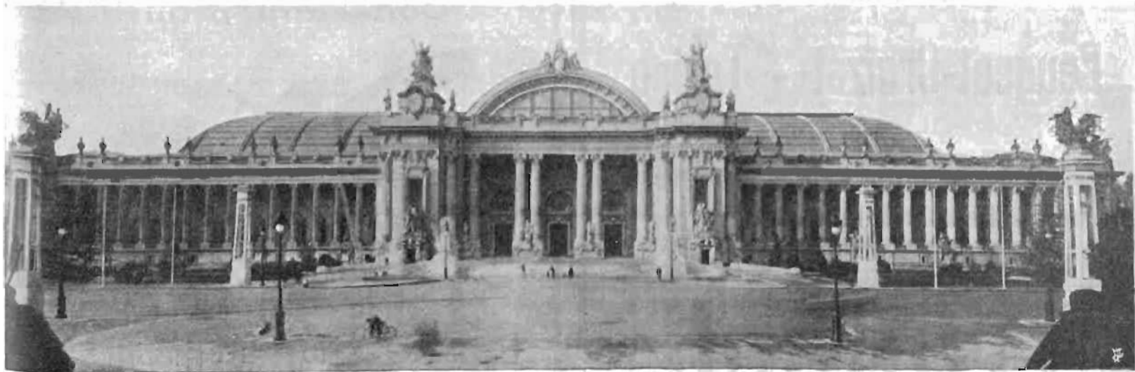
Veduta del Gran Palais di Parigi, dove ha luogo la IX Esposizione dell'Automobile e del Ciclo (7-28 dicembre)