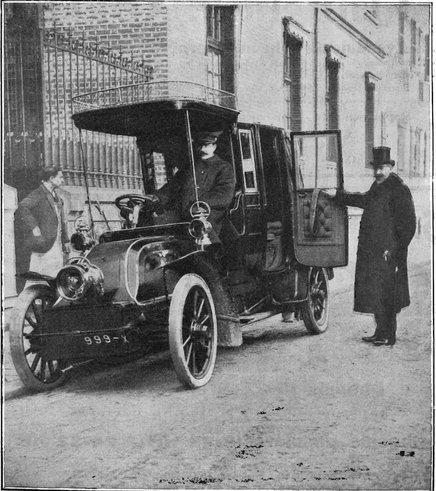
Rouvier, il nuovo presidente del Consiglio dei ministri di Francia, chauffeur.

Per trattative rivolgersi presso l'Amministrazione del Giornale