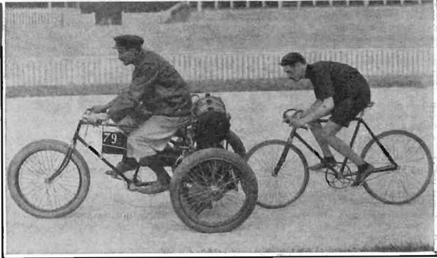
Le tappe dell'allenamento ciclistico.

Ma, intendiamoci, la mostra che noi crederemmo possibile e di cui sarebbe sicuro il successo, dovrebbe essere una fiera, a cui fabbricanti e rappresentanti, e soprattutto privati possessori d'automobili, esponessero le macchine di cui intendono fare la vendita o il cambio con consegna immediata, e a cui accorrerebbero a migliaia tutti coloro che intendono comperare una macchina, e soprattutto tutti quelli che, volendo prima fare un assaggio delle loro attitudini automobilistiche,