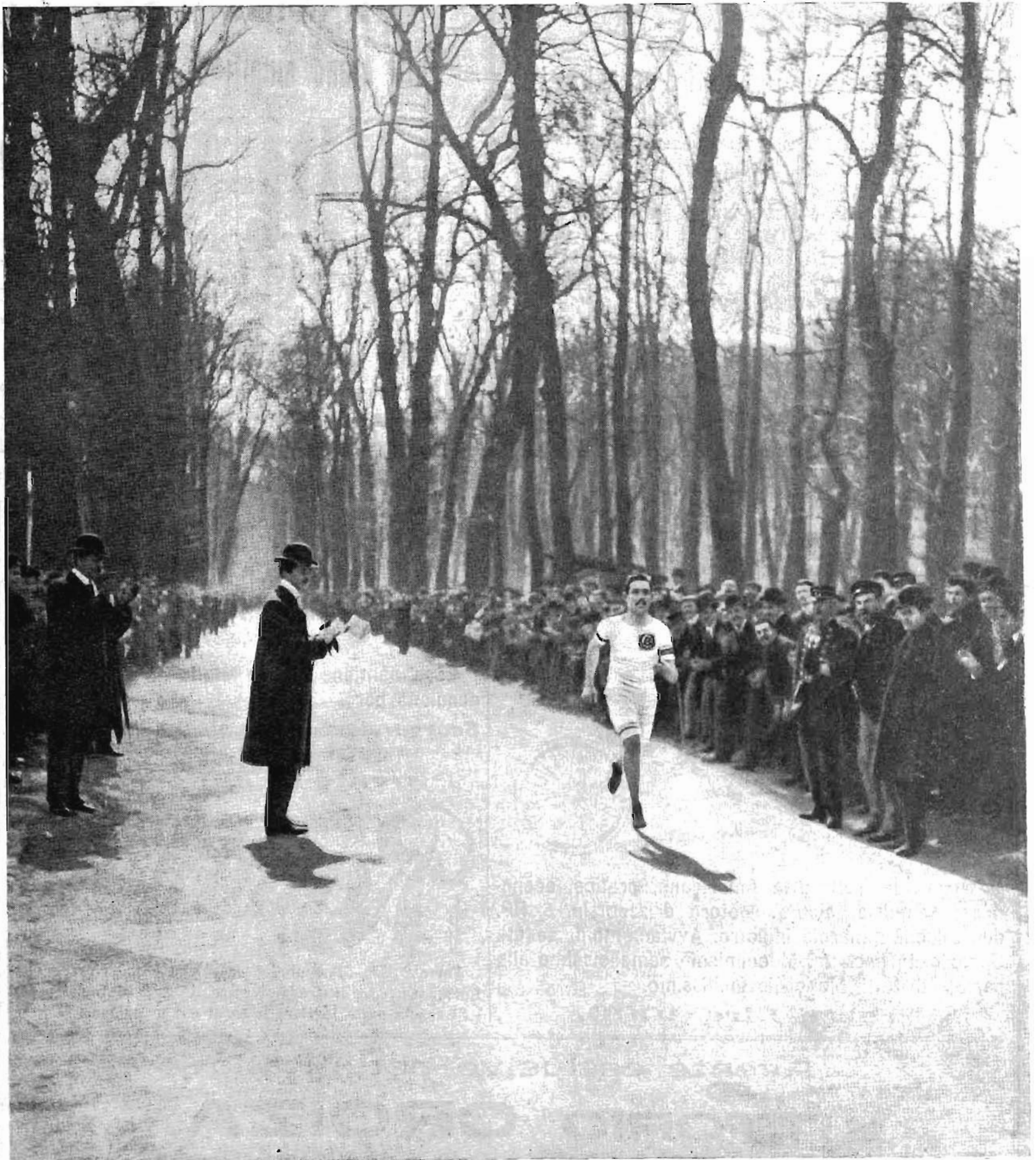
Le grandi corse pedestri a Parigi - L'arrivo della corsa dei 5 km. nella foresta di Neuilly.

INSERZIONI Per trattative rivolgersi presso l'Amministrazione del Giornale