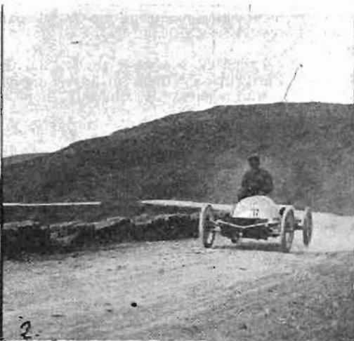
(Vettura Florentia, 8 HP).