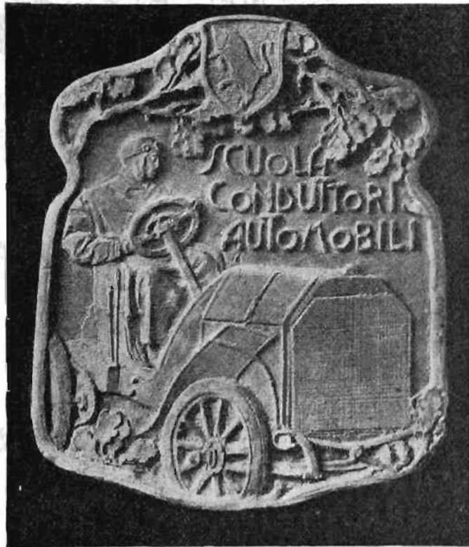
Medaglia ricordo (opera dello scultore Fumagalli) offerta agli allievi della Scuola Torinese di meccanici e conduttori di automobili che hanno superato l'esame di guida nel 1905.

Oltre alle robuste biciclette la Società continua la costruzione della popolare vettura Olav, una meraviglia di costruzione e di prezzi.