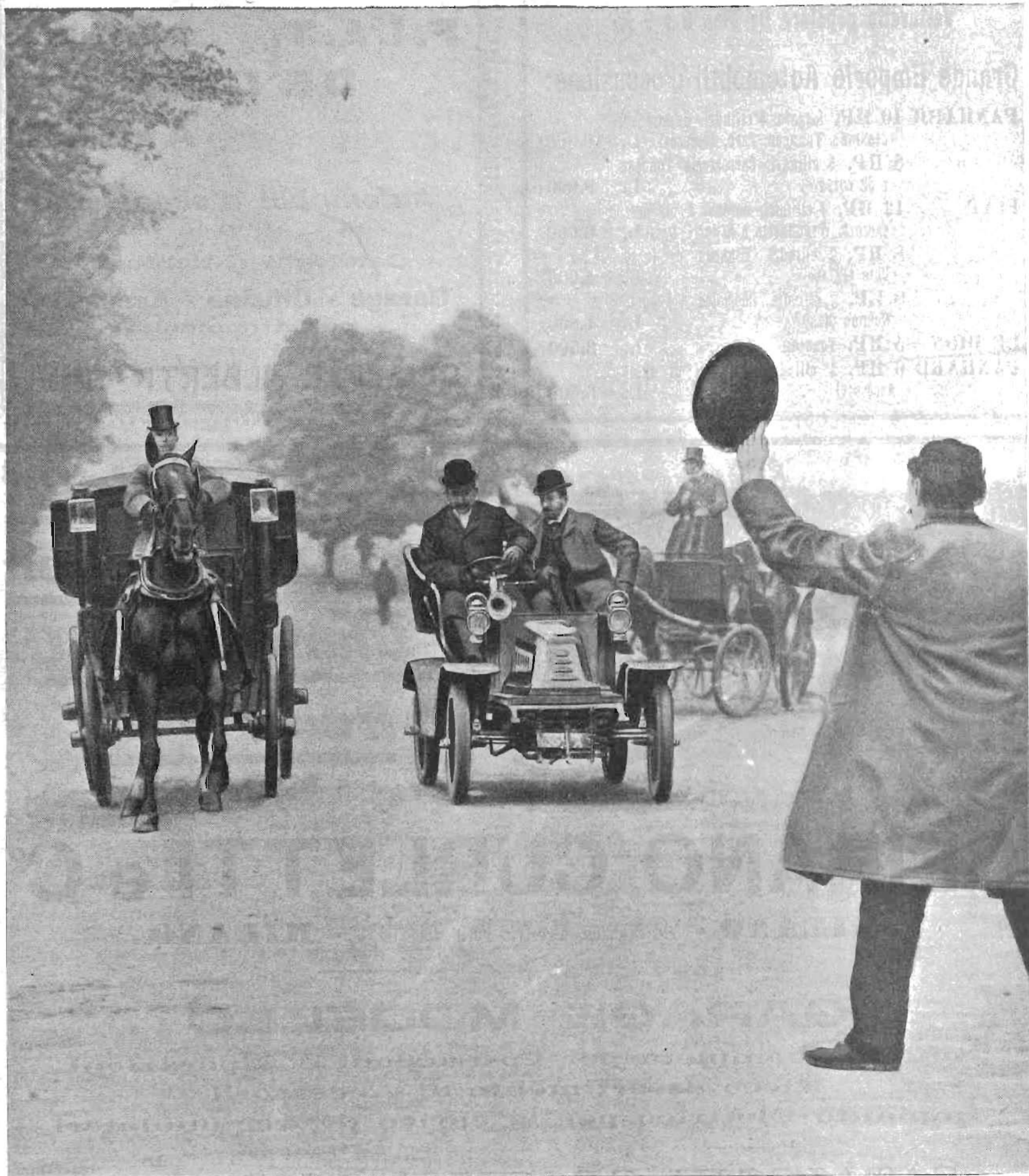
Esperimenti sulla sicurezza e praticità degli automobili. - Dato improvvisamente il segnale d'arresto a una vettura a cavalli e a un'automobile, la prima si ferma nello spazio di metri 10 mentre per la seconda bastano metri 3.

INSERZIONI Per trattative rivolgersi presso l'Amministrazione del Giornale