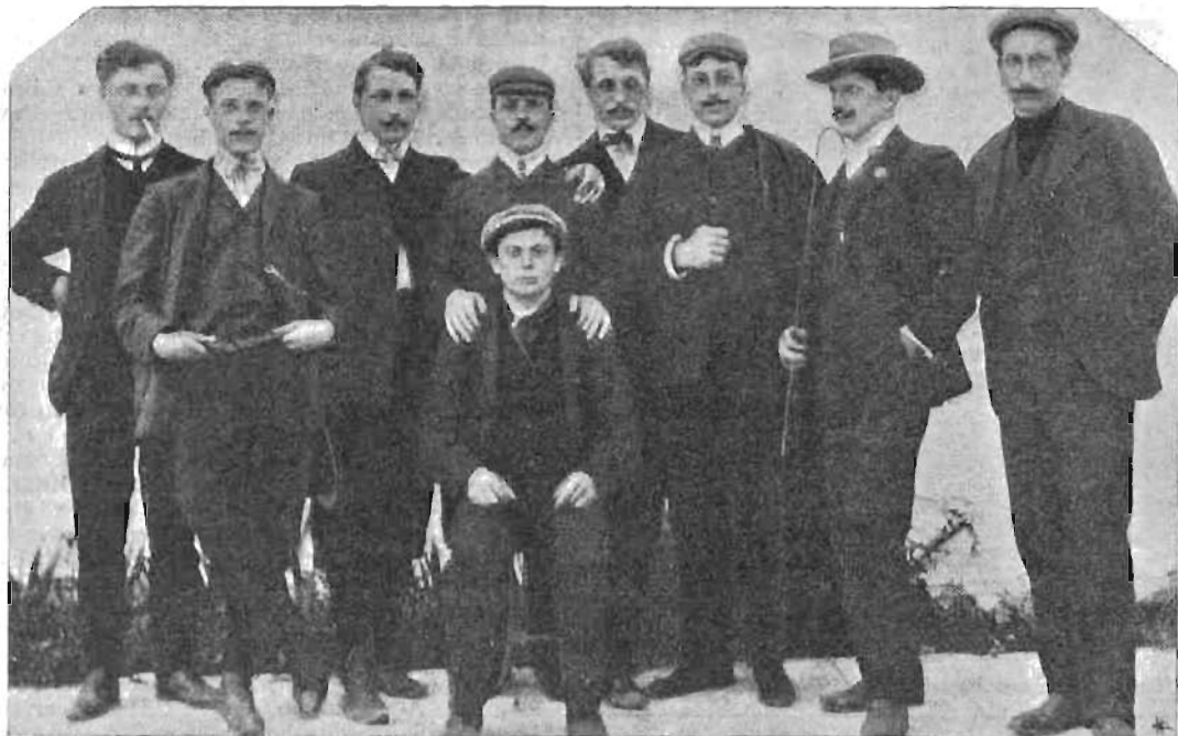
Michiels Rossino Restelli Chiozza Gardenghi Ehrmann Carapezzi Galadini Giuppone.